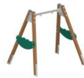
004141 Качели (13 изумрудный-салатовый-желтый) - 2 шт.