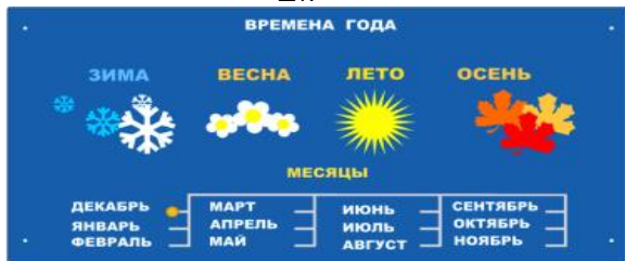
002501 Игровая панель "Времена года" (53 Синий) - 1 шт.