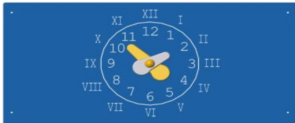
002528 Игровая панель "Часы" (53 Синий) - 1 шт.