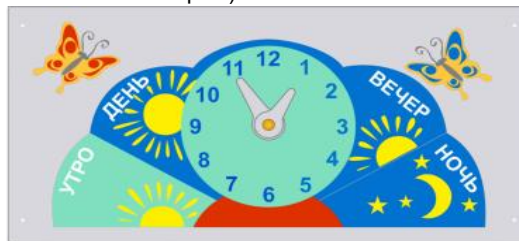
002521 Игровая панель "Время суток" (66 Светло-серый) - 1 шт.