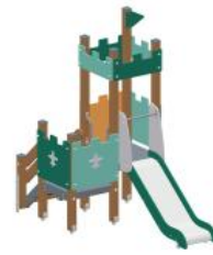
005291 Детский игровой комплекс "Мини-крепость" (13 изумрудный-салатовый-желтый) - 1 шт.