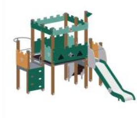
005297 Детский игровой комплекс "Крепость" (13 изумрудный-салатовый-желтый) - 1 шт.