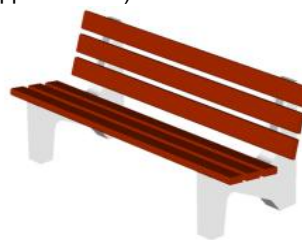
002105 Диван садово-парковый (28 Серый Терракотовый) - 2 шт.